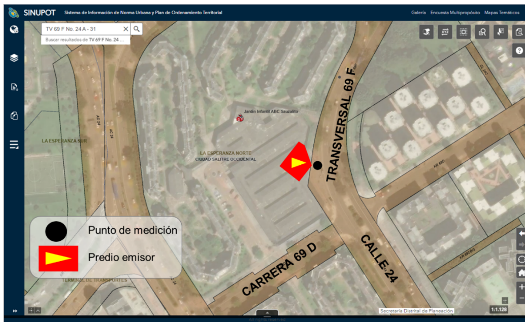
Figura No. 1. Ubicación del predio emisor y punto de medición.